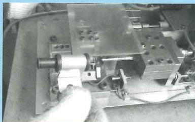
▲ グロメット挿入機