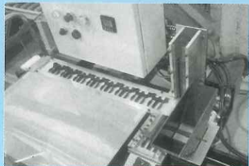
▲ 部品自動組付け機