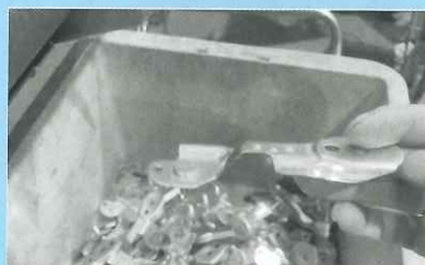
▲ 順送型内ボルト加締め