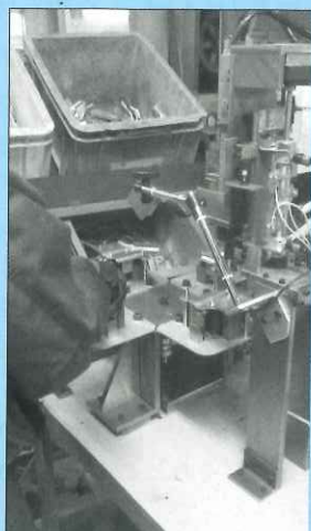
▲ ナット組付け半自動機